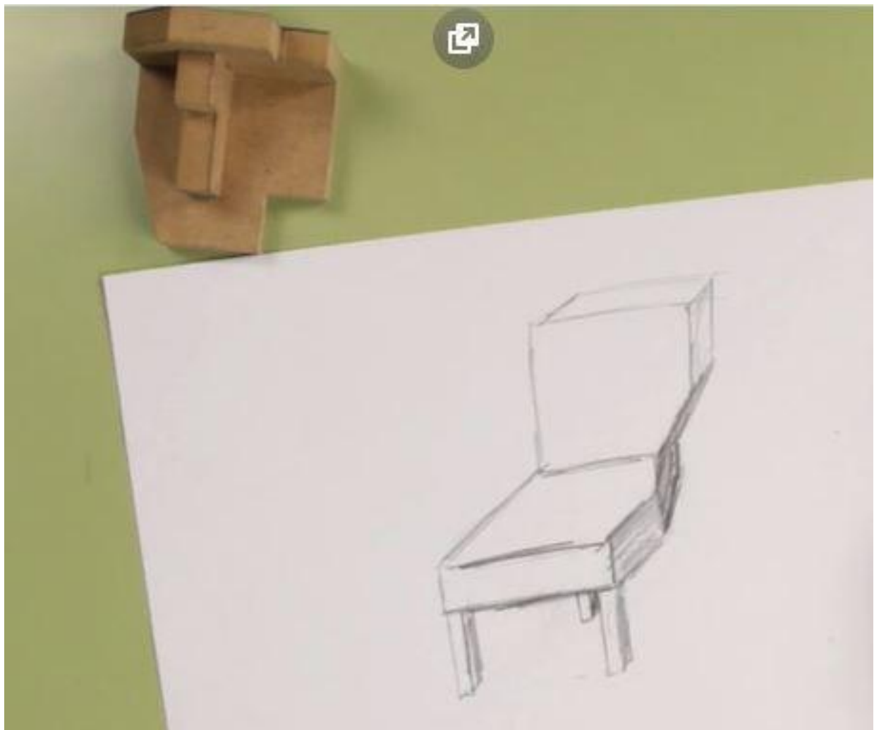
Ejemplo ejercicio 3.1

Inspirándose en el objeto propuesto por el tribunal, realizar un boceto a mano alzada (en perspectiva isométrica, caballera, o cónica, etc...) de un diseño propio con el fin de obtener un espacio arquitectónico o escenográfico, una pieza de mobiliario o un objeto de uso doméstico (silla, mesa, lámpara, etc...)