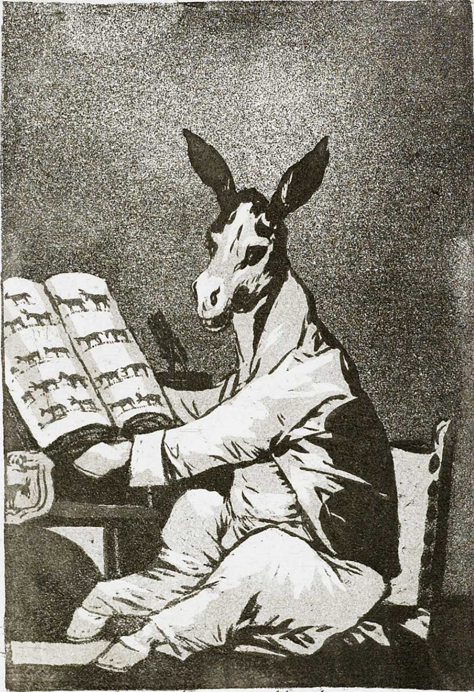
Asta su Abuelo.